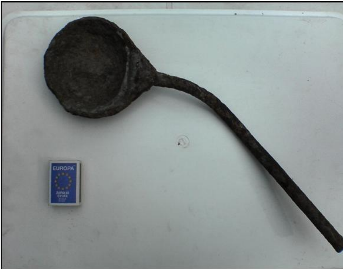
Vas önt kanál, sárgaréz nyomokkal./Középkori (?)/