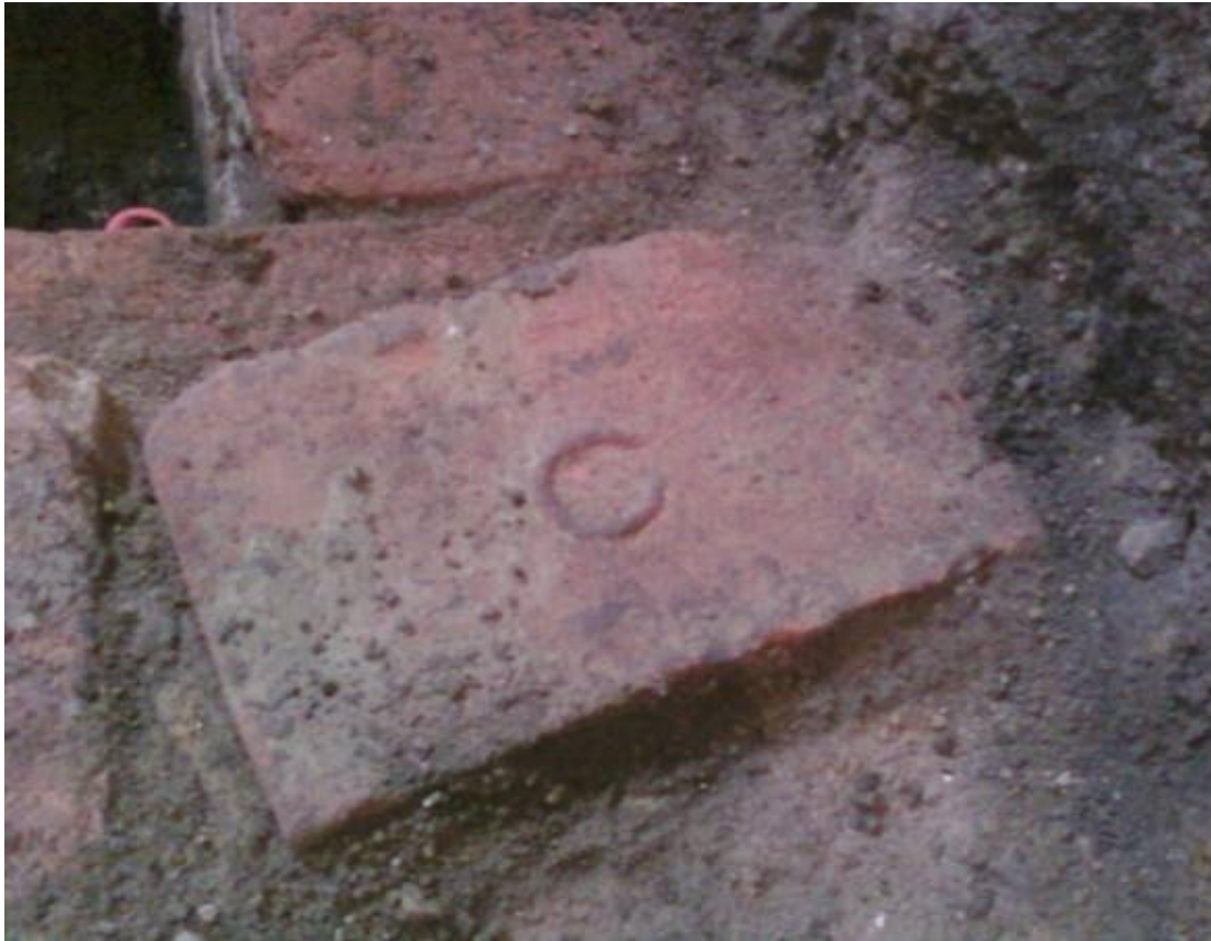
Félholdas török tégl