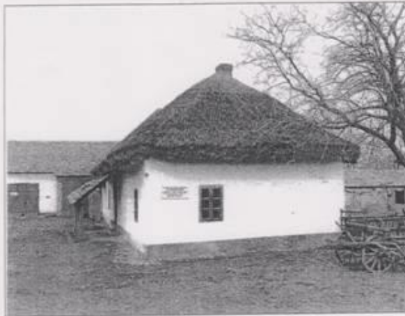
2. kép Vámház (Bikaakol) (V. L.)

„Évszázadokon át e helyen állt az a vámház, amely a tiszai bódái révvel egyenrangú korszak átkelő helyet vígyázta. Az átkelők a XX. századig szolgálták őseinket. Eredetileg ez az épület a vámház volt.”