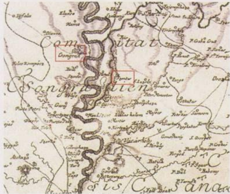
133. oldal Müller Ignác 1774