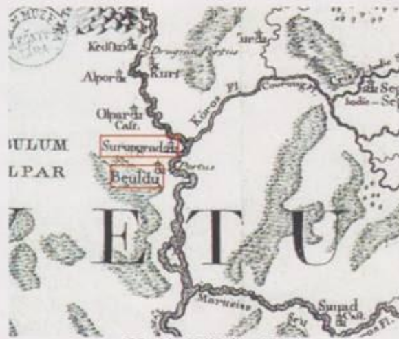
135. oldal Hell Miksa 1772