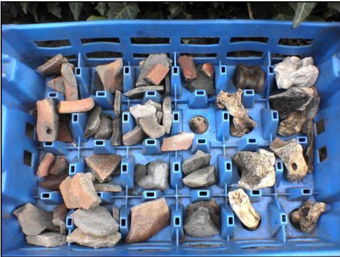
Vegyes korú leletek