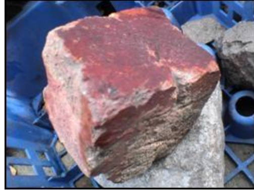
Különböz korú cseréptöredékek. Festett vörös-márvány darab.