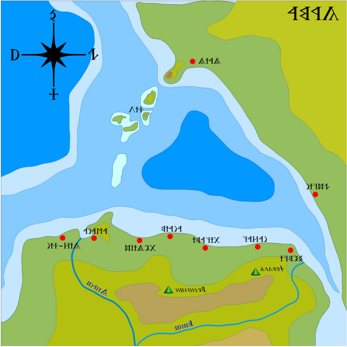
.УАԼԻԶԱՅԻ ՆՅԱԿԱԿԱ ԿՎԱԿՄԱՅԻԿՅՍ ԾՆԻՊԱԿԱԿԱ ԾԱԿՊՈՑ ԳԻՅՈՒՆԻՎ 4 ՅՈՒԿՅՍ ԿՅՎԱ Ե http://www.civilization.ru/ Ե ՆՈՒՎ